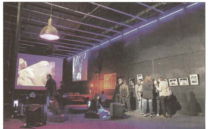
Expo, video, photos, pour cette rétrospective sur la chorégraphe et danseuse Anna Halprin