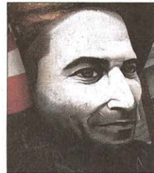
« Tizne » : portraits / Claude Essertel

d'un cancer. Elle a participé aux manifestations contre la guerre en Irak. Elle a lutté contre la ségrégation. C'est quelqu'un qui va beaucoup plus loin dans la danse. Pour cette exposition, j'ai présenté des photos et je me suis juste centrée sur un travail emblématique qui tourne autour de ce moment, où elle commence à travailler avec du papier kraft pour faire du son. Pour cette exposition, j'ai associé l'archive et ce film de 2004, quand elle a joué à Beaubourg, pendant le festival d'automne. J'ai installé aussi sept vidéos : une à l'entrée où elle danse constamment. Il y en a une où elle est engagée contre la guerre du Vietnam, ainsi qu'une vidéo de 57 minutes, une station d'écoute de musiques, avec des musiciens qui ont beaucoup travaillé avec elle. C'est de la danse, de l'écoute, des vidéos et des photos. Pour que ce soit vivant et chaleureux.